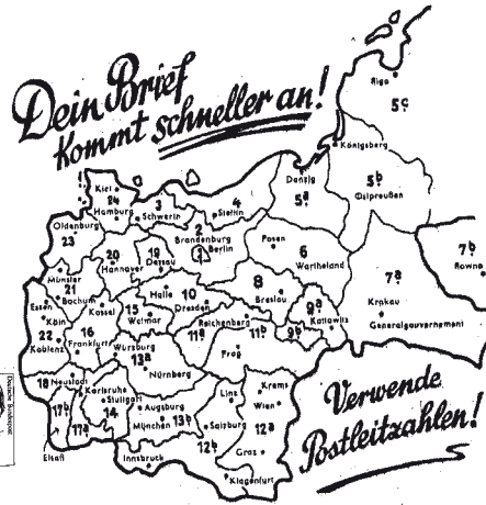
Übersichtskarte von 1944

Zunächst ein Rückblick auf die Anfänge der Postleitzahlen überhaupt. Im Kriegsjahr 1941 führte die DEUTSCHE REICHSPPOST weltweit die ersten Postleitzahlen ein, um die große Flut der Feldpostpäckchen bewältigen zu können. Das Deutsche Reich wurde deshalb in 24 Postleitgebiete aufgeteilt. Ab dem 19. 10. 1943 galt diese Anweisung auch für den Briefverteildienst. Indem den Nummern der Postleitgebiete kleine Buchstaben hinzugefügt wurden (z.B. 20a und 20b) entstanden 1944 zusätzlich 32 neue Leiträume. Nach dem Krieg wurde das alte System übernommen und bereits 1947 in der britischen Besatzungszone weitergeführt. Im Jahr 1961 hatten die alten zweistelligen Postleitzahlen ausgedient und wurden am 1. 11. 1961 durch die vierstelligen Postleitzahlen ersetzt. Durch die fortschreitende Automation und die Zu-